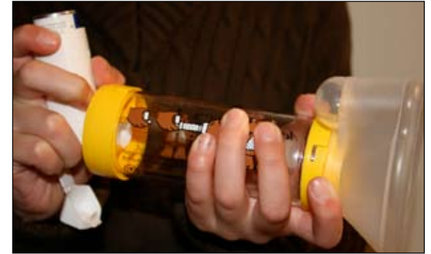
3. Únalo al espaciador