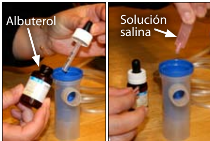
5. Añada albuterol y solución salina