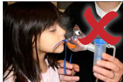
¡ASÍ NO! NO sostenga la mascarilla adelante de la cara.