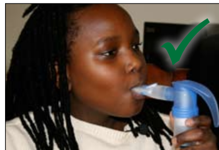
9. Ponga los labios alrededor de la boquilla. Inhale lentamente por la BOCA