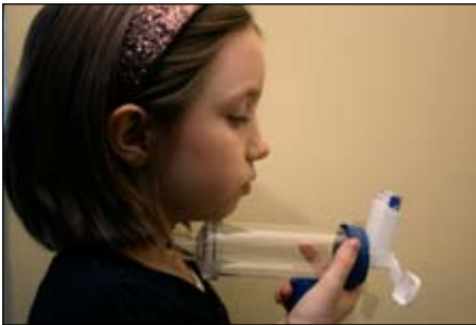
5. EXHALE completamente.