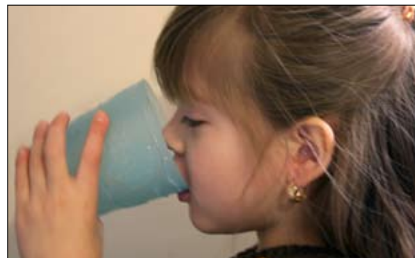
7. Enjuáguese la boca con agua y ESCUPA

Si necesita otra inhalación del medicamento, espere UN minuto. Después repita los pasos 4 a 6