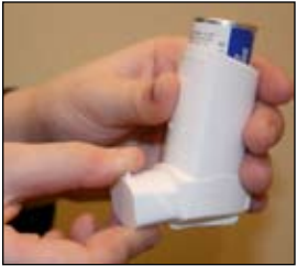
1. Saque el tapón del inhalador.