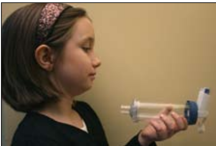
9. Aguante la respiración por diez segundos, si puede. Después exhale lentamente.