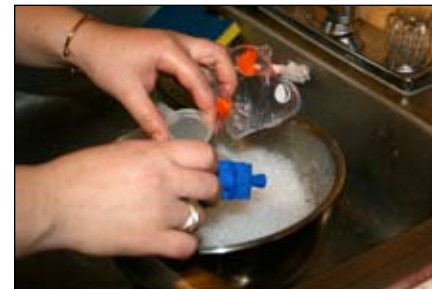
10. Cuando termine, lave las piezas en agua jabonosa y enjuáguelas