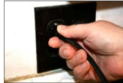
3. Enchufe el nebulizador