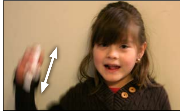
2. Agite el inhalador