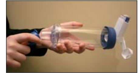
4. Quitele la tapa al espaciador.