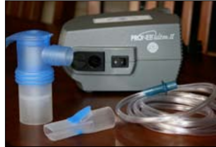
2. Ponga el nebulizador en una superficie plana y estable