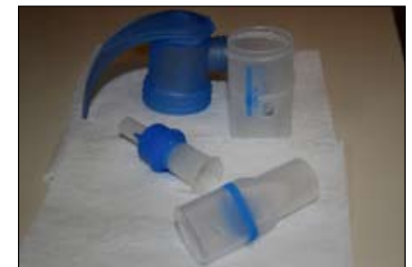
11. Deje secar las piezas al aire