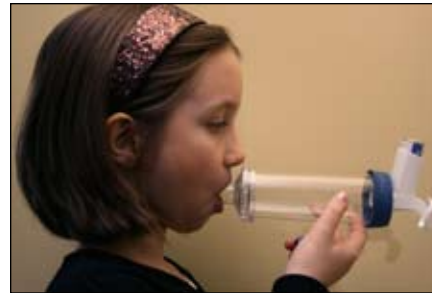
6. Cierre los labios alrededor de la boquilla.