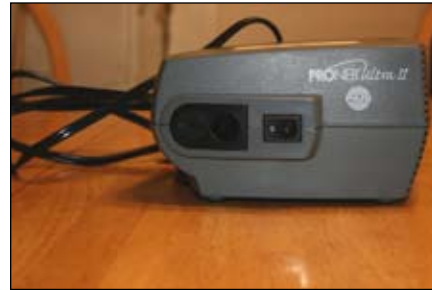
2. Ponga el nebulizador en una superficie lisa y firme