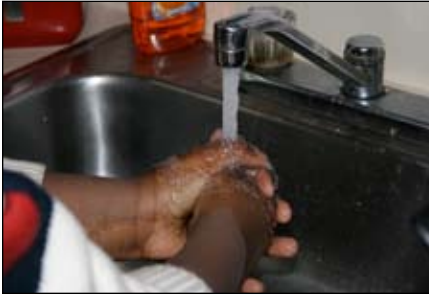
1. Lávese las manos