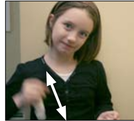
2. Agite el inhalador.