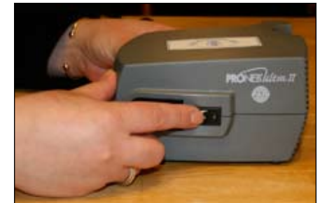
8. Prenda el nebulizador