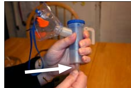
7. Conecte el otro extremo del tubo al recipiente del medicamento