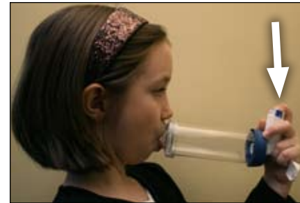
7. Apriete aquí hacia abajo.