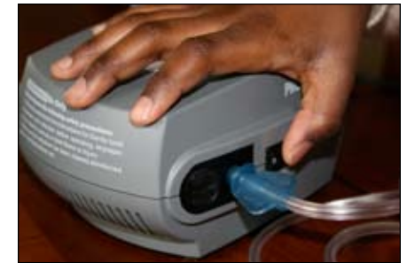
8. Prenda el nebulizador