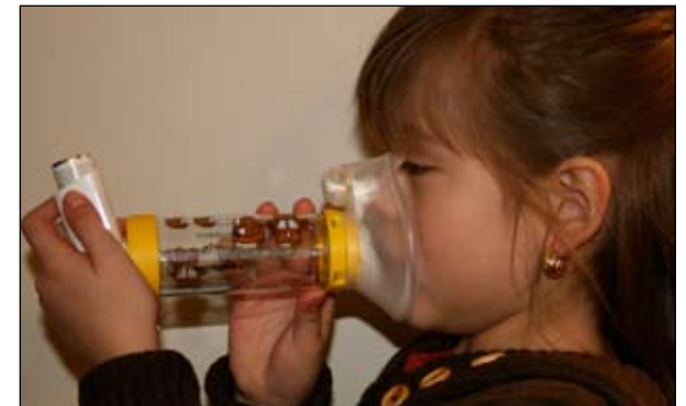
6. Inhale y exhale seis veces