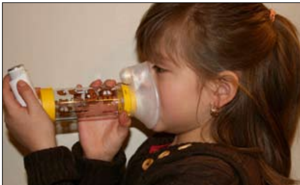
4. Derecho y póngase la mascarilla sobre la nariz y la boca