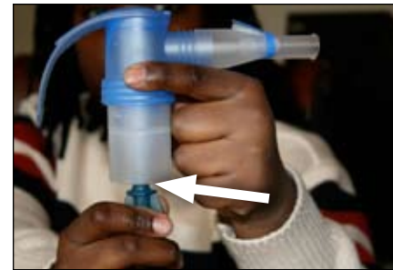
7. Conecte el otro extremo del tubo al sostenedor del medicamento