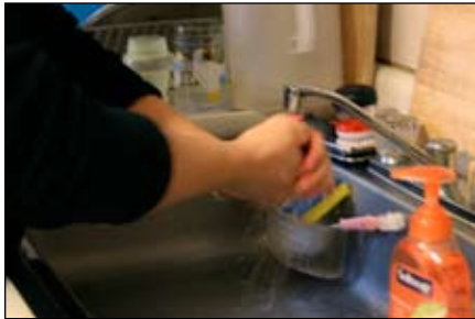
1. Lávese y séquese las manos