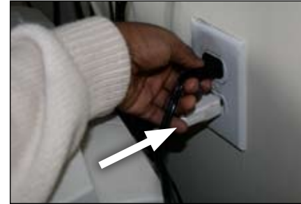
3. Enchúfelo en la pared