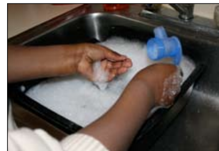
10. Cuando termine, lave las piezas en agua jabonosa