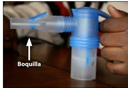
6. Conéctela boquilla al sostenedor del medicamento