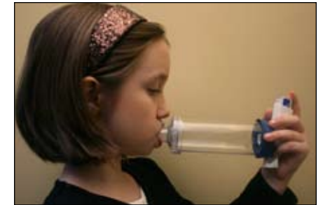
8. INHALE LENTA y Profundamente