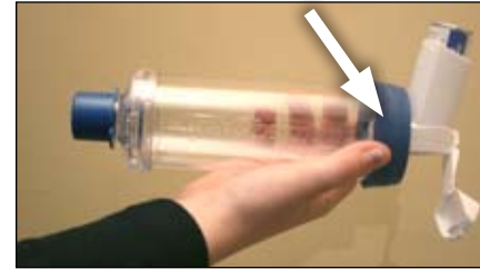
3. Conéctelo al espaciador.