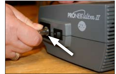
4. Conecte un extremo del tubo al nebulizador