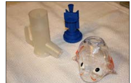
11. Deje que las piezas se sequen al aire