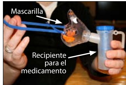
6. conecte la mascarilla al recipiente para el medicamento