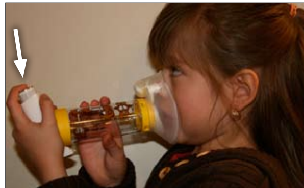
5. Apriete aquí hacia abajo. Eso hace que entre medicamento al espaciador