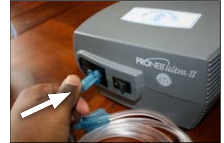
4. Conecte un extremo del tubo al nebulizador