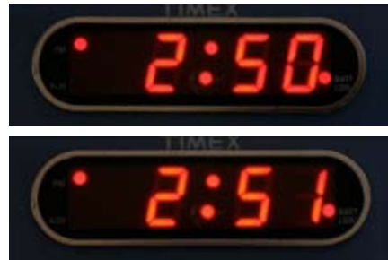
Si necesita otra inhalación del medicamento, espere UN minuto. Después repita los pasos 5 a 9.