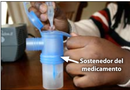
5. Añada el medicamento